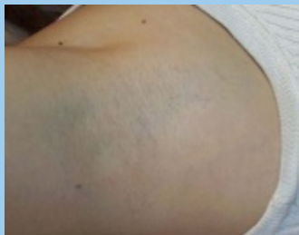
Na drie behandelingen